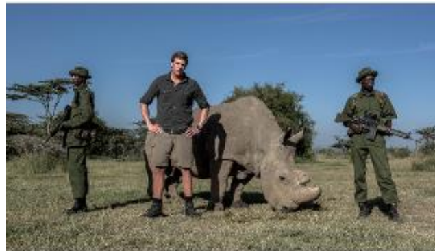
Freek tegen de Stropers

ervoor zorgen dat het goed blijft gaan met iets